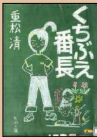
「くちぶえ番長」 重松清著 / 塚本やすし挿絵 (新潮社)

幼少の頃より独学で絵を学び路上でもチラシの裏でもなんでも絵を描きまくる。玄光社ザ・チョイスで長新太や吉田カツの審査で入選。絵本に『このすしなあに』『はしれ! やきにくくん』(ポプラ社)『このおっばいだあれ』(サンマーク出版)『はやくおおきくなりたいな』など、エッセイに「猫とスカイツリー」など著書多数あり。