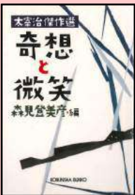
森見登美彦編 「奇想と微笑 太宰治傑作選」 (光文社、2009年刊)

そして大衆小説以外にも愛猫家や鎌倉の自然保護で知られる大佛次郎、ファッション雑誌の創刊など実業家の面を持つ女性作家の宇野千代と多才な文人が続きます。