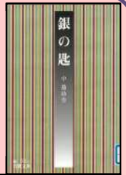
中勘助著「銀の匙」 (岩波書店、1999年刊)