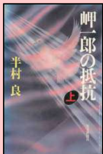
半村良著「岬一郎の抵抗.上」 (毎日新聞社、1988年)

「日本SFの始祖」の一人である海野十三、「架空戦記」の代表的作家である荒巻義雄、「伝奇SF小説」で知られる半村良が酉年生まれです。