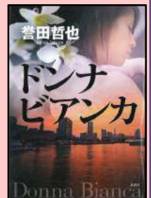
誉田哲也著 「ドンナ ビアンカ」 (新潮社、2013年)