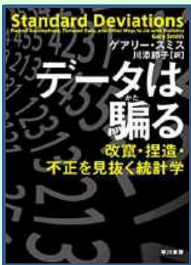
ゲアリー・スミス著 「データは騙る」 (早川書房, 2019 年刊)

図書館には、統計をどうやって見ればよいか、などがわかりやすく書いてある本がありますので、どうぞご利用ください。