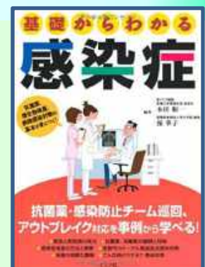
本田 順一ほか著 「基礎からわかる感染症」 (ナツメ社, 2012 年刊)

消毒や予防については、いままで起こったSARSやインフルエンザなどの感染症への対策が参考になるでしょう。これについては図書館で本を見ることができます。