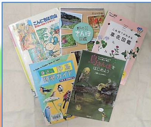
「流山新100ヶ所めぐり」ほか、草花や鳥の観察ガイド

また少し古い本ですが「こんにちは流山新100ヶ所めぐりガイド」(流山市, 1997年)には、東部地域をめぐるコースがいくつか紹介されていますので、ご参考になさってください。