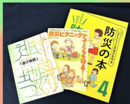
日頃から災害時の避難について考えるための本