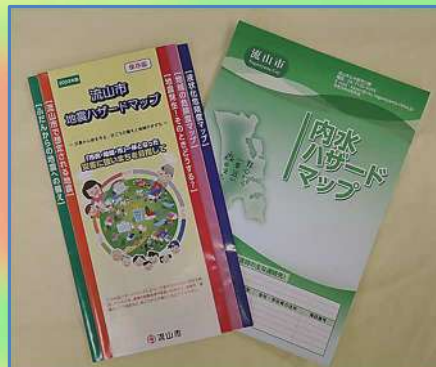
流山市が発行しているハザードマップ

「流山市地震ハザードマップ」「流山市内水ハザードマップ」(流山市, 2023年)には、避難所や避難場所が書いてあります。また、流山市のホームページで「くらしの情報」のなかにある「防災」という項目から、ハザードマップへたどっていくことが出来ます。