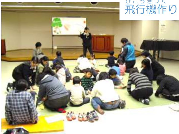
ひこうきづく 飛行機作り

どちらの飛行機も最後がチョットむずかしいです。説明をよーくきいて、がんばっておっていました。目指すは優勝！！