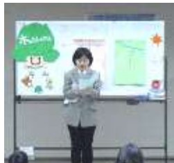
競技委員長の挨拶