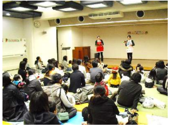
たのしい おはなしだったね。