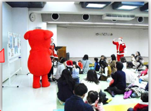
サンタさんの あとから チーバくんも！