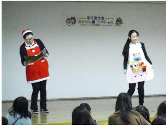
「み～んな 金のがちょうに ぴたーん！」