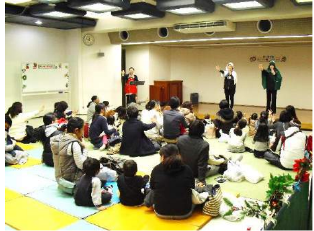
サンタさんで『メリークリスマス！』