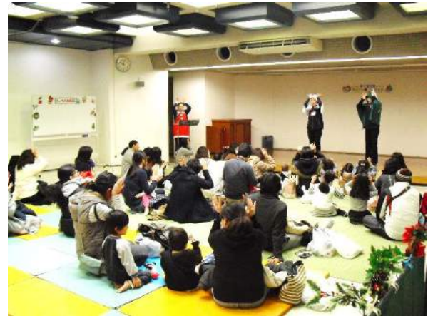
『♪4と4で トナカイさん』