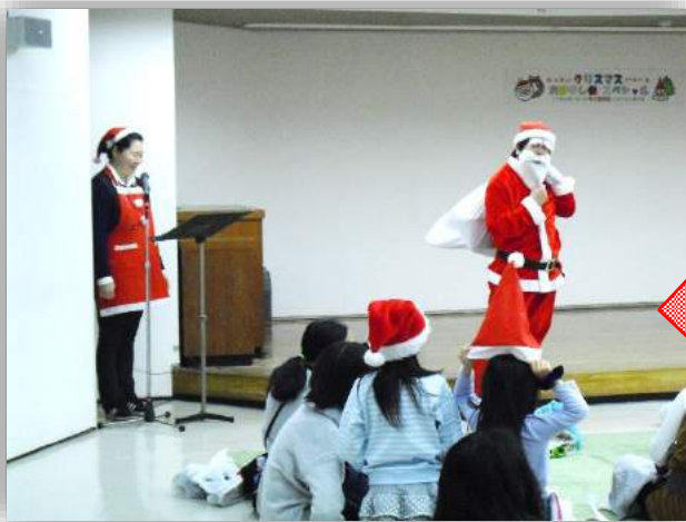
「シャンシャンシャン♪」そりに のって サンタさんが きてくれました