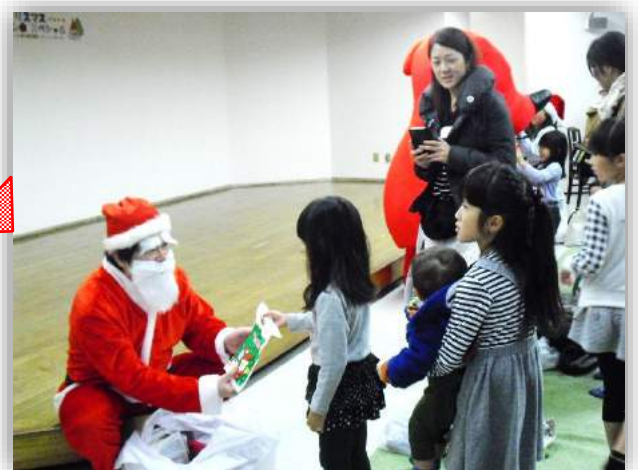
みんなに クリスマスプレゼント！！ 「ありがとう」「メリークリスマス」って みんなが あいさつを してくれたので サンタさん とっても よろこんでました。