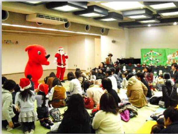
みんな おおきなこえで