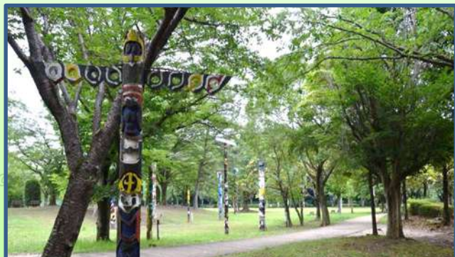
流山市総合運動公園：ピクニック広場のトーテムポール