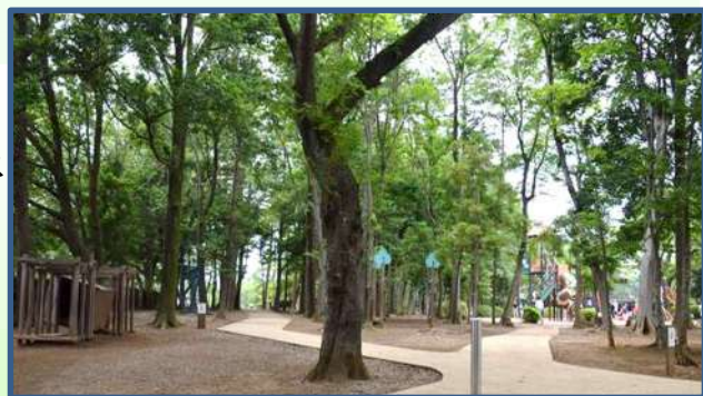
流山市総合運動公園：アスレチック広場

流山市総合運動公園の屋外部分は、2021年から順次整備が行われて、昨年7月にアスレチック広場全体が公開されました。ここは木立が茂る小高い丘となっていて、涼しい木陰の中を散策することができます。