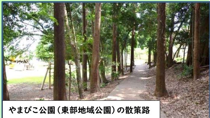
やまびこ公園(東部地域公園)の散策路